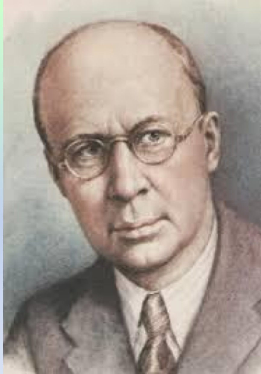
С. С. Прокофьев