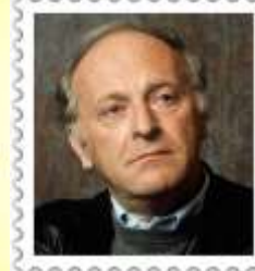
Иосиф Александрович Бродский