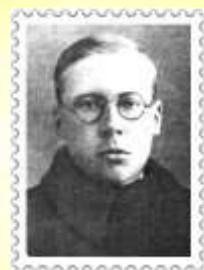
Николай Алексеевич Заболотцкий