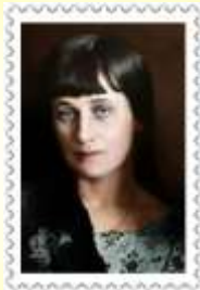
Анна Андреевна Ахматова