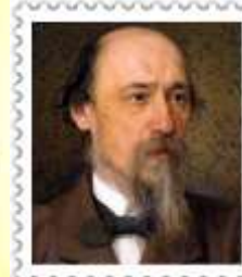
Николай Алексеевич Некрасов