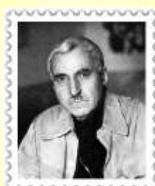
Константин Михайлович Симонов