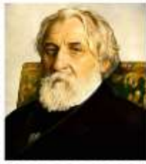
Иван Сергеевич Тургенев