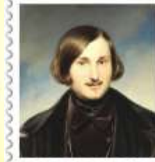
Николай Васильевич Гоголь