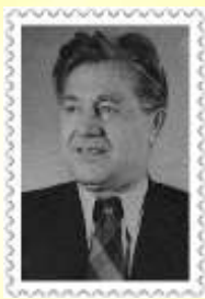
Алексей Александрович Сурков