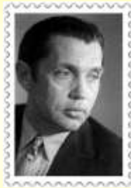
Роберт Иванович Рождественский