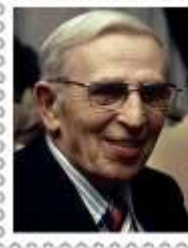
Клиффорд Дональд Саймак