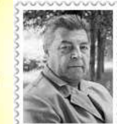
Иван Антонович Ефремов