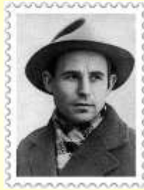
Николай Михайлович Рубцов