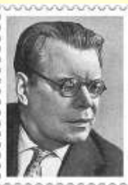
Михаил Васильевич Исаковский