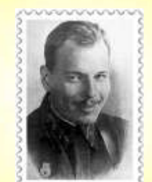
Георгий Кузьмич Суворов