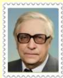
Лев Иванович Ошанин