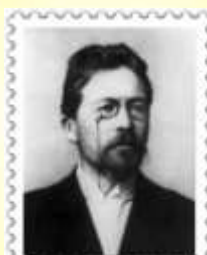
Антон Павлович Чехов