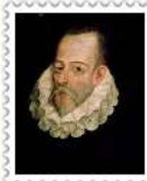
Мигель де Сервантес