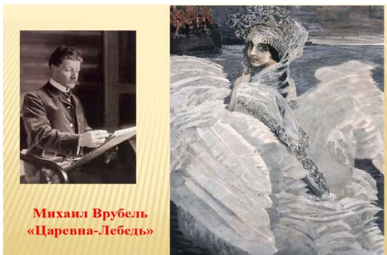
Михаил Врубель «Царевна-Лебедь»

Учитель демонстрирует учащимся картину Михаила Врубеля «Царевна-Лебедь».