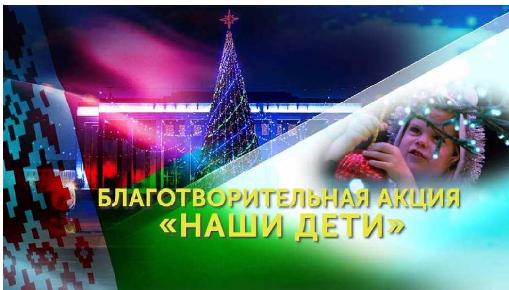
Акция «Наши дети».