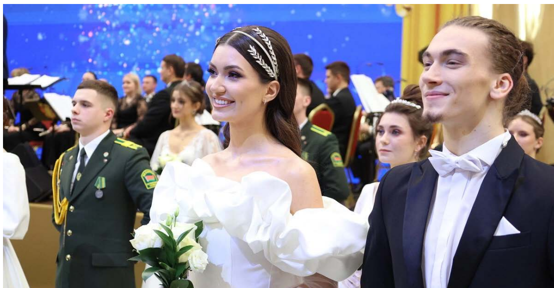
Республиканский новогодний бал для молодежи.