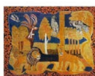
Алена Киш (1889–1949)

— народная белорусская художница-примитивистка, создававшая уникальные маляванки. Её наивные, яркие работы с фантазийными сюжетами не имеют аналогов в народном искусстве и признаны во всём мире. Имя Алены Киш включено во Всемирную энциклопедию наивного искусства как одного из 800 самых известных художников-примитивистов.