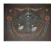
Язэп Дроздовіч (1888–1954)

— выдающийся белорусский художник, график, скульптор, этнограф и фольклорист. Он первым из профессиональных художников обратился к созданию маляванок, чем поднял этот народный промысел на новый уровень. Дроздович такие знаменит своим фантастическими графическими работами на космические темы и детальными зарисовками белорусской архитектуры.