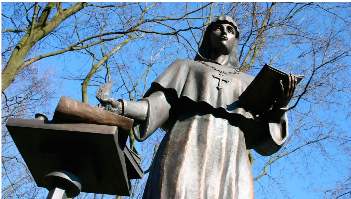
Памятник Евфросинии Полоцкой во внутреннем дворе БГУ.